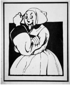
Affiche, Becassine , Fonds MLF Genève, MLF-GE/S3/SS42/D28/P59, N179