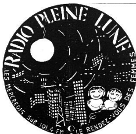
Autocollant Radio Pleine Lune , Radio pirate active de ca. 1981 à 1984, Fonds MLF Genève, MLF-GE/S4/SS13