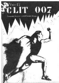
Clit007 , « Concentré lesbien irrésistiblement toxique », n°2, février 1982, Revue parue de 1981 à 1986, Fonds MLF Genève, MLF-GE/S2/D20