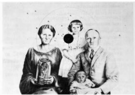
Bon Sang ! , Une du n°22, 1985, Bulletin de contre-information santé des femmes paru entre 1980 et 1985, Fonds MLF Genève, MLF-GE/S2/D19