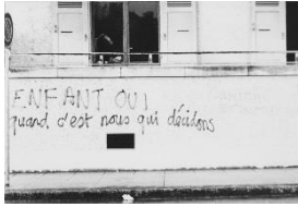
Photographie d'un graffiti, Fonds MLF Genève, MLF-GE/S3/SS43