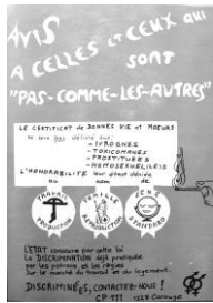
Tract Avis à celles et ceux qui ne sont pas comme les autres , ca. 1977, Fonds MLF Genève, MLF-GE/S4/SS12