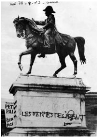
L'Insoumise , n°9, mai 1978, Fonds MLF Genève, MLF-GE/S2/D21