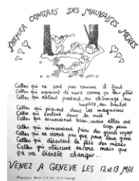
Tract, Premier congrès des mauvaises mères , 1979, Fonds MLF Genève, MLF-GE/S4/SS37