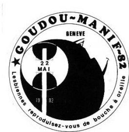
Autocollant Goudou-manif , 1982, Fonds MLF Genève, MLF-GE/S2/D86