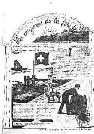
Tract Les origines de la fête des mères , 1978-1979 ?, Fonds MLF Genève, MLF-GE/S4/SS37